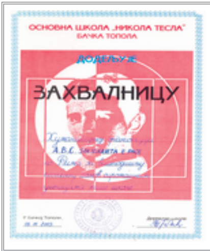
Un attestato della scuola “Nikola Tesla” di Backa Topola

Infatti, non siamo una grossa organizzazione e il nostro volontariato parte dalle piccole cose. Lavoriamo senza posizioni pre-costituite di natura ideologica, politica e religiosa. Cerchiamo di prestare attenzione alle cose che diciamo e facciamo.