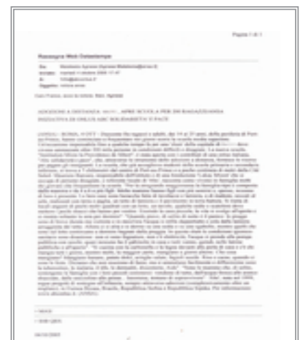
La notizia ANSA sul nuovo progetto di “ABC” in Haiti