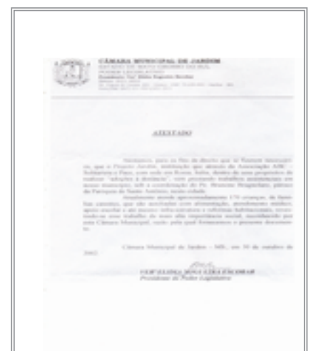
Il sindaco di Jardim testimonia il lavoro di “A, B, C” nella sua cittadina

“A, B, C” - dicembre 2000 - Lo scorso aprile abbiamo avviato, in collaborazione con "il manifesto", un nuovo progetto: "Pancevo chiama Italia". Il petrolchimico di Pancevo veniva colpito il 25 marzo 1999 e nei giorni successivi fino alla distruzione totale. Centomila tonnellate di prodotti chimici si trasformarono in pericolose "bombe" ecologiche: fu l'"indotto" della morte. Cvm (clorovinilmonomero, quello di Porto Marghera), Pvc (polivinilcloruro), dicloroetilene, sodio, acido cloridrico, mercurio, ammoniaca, cloro liquido, ecc. sono alcuni dei prodotti chimici che finirono nell'aria, nell'acqua, nella terra. Oggi a Pancevo la guerra è come se non fosse finita: alle bombe è succeduta l'emergenza ambientale. Il rischio più grande riguarda le acque, minacciate dall'introduzione di notevoli quantitativi di prodotti chimici che si stanno bioaccumulando in fiumi, pozzi, sorgenti e depositi acquiferi. L'iniziativa ha lo scopo di reperire strumenti e attrezzature, o i fondi per acquistarli, di cui ha bisogno l'Istituto d'igiene e tutela ambientale del Banato del sud, diretto da Mika Saric Tanaskovic.