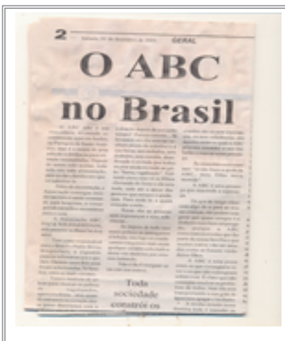
Il giornale brasiliano “Tribuna popular” parla dell'associazione