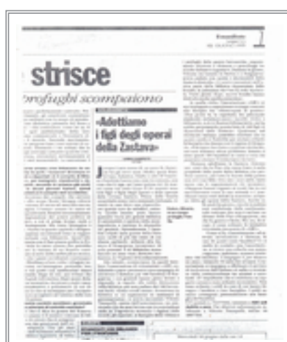
“il manifesto” e l'adozione dei figli degli operai della “Zastava”