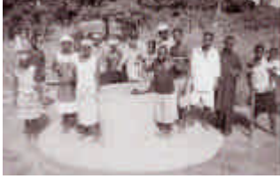
In posa intorno al pozzo dell'orto di Braia

Per scavare i pozzi servono tre cose: mezzi, competenze, fortuna! I mezzi e le tecnologie a disposizione non sono molti, le competenze ci sono, la fortuna a volte c'è altre volte no.