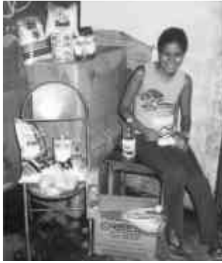
Ogni 15 del mese viene distribuito il pacco con i prodotti alimentari