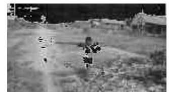
Sulla strada, Parintins, la solitudine di un bambino

intervenire per proporre il cambio dell'affido, voi perché dovete decidere se destinare a qualche altro bambino il vostro aiuto. Mentre a Jardim e Guia Lopes da Laguna questo fenomeno ha una dimensione limitata, a Parintins gli spostamenti interni sono più frequenti e determinato un'instabilità che è impegnativa dal punto di vista emotivo e organizzativo.