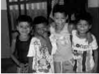
Un gruppo di giovani amici del Centro di accoglienza