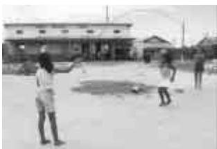
Un momento di gioco

Se c'è una cosa che non manca a Parintins sono i bambini. Ne nascono continuamente e, se potessero scegliere, la maggior parte di loro frequenterebbero volentieri il Centro "Nossa Senhora das Graças". Nella lunghissima lista di chi è in attesa di partecipare alla vita comunitaria del Centro ci sono circa 500 nomi. Intanto è bene precisare che il bambino viene iscritto gratui-