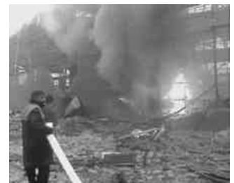
Per non dimenticare!

intervento, tranne laddove afferma (ultimo capoverso) che ‘da due anni la città [di Pancevo] riceve promesse ma nessuno ha ancora fatto niente’. Vi informiamo che, invece, almeno un'associazione dai mezzi limitati quale è la nostra, qualcosa ha fatto... acquistando strumenti e materiali d'uso per decine di milioni, destinati all'Istituto d'igiene di quella città”.