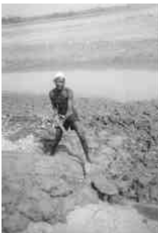
In risaia, un "homen grande" (adulto) costruisce la diga della sua risaia usando il "radi", una lunga pala di legno