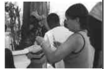
Morena durante la campagna per le vaccinazioni

rità di questa nostra scelta è arrivata, recentemente, la comunicazione del ministero delle "Recursos Naturais" con la quale si informano tutte le Associazioni e le ONG presenti in Guinea Bissau che per poter lavorare all'escavazione di pozzi occorre avere l'autorizzazione del Ministero. Ci siamo dunque affidati ad un notaio (l'unico notaio, ndr.) con il quale abbiamo definito gli aspetti giuridici indispensabili per costituire l'associazione "A, B, C, solidariedade e paz - Guiné Bissau" che ha poi provveduto al suo "atto di nascita".