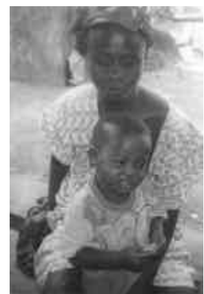
Un bambino mentre mangia un pomodoro!

frutti" e gli uomini più giovani "incominciano ad intuire che il loro contributo è indispensabile perché, anche se per tradizione la coltivazione orticola è un'attività delle donne, la famiglia intera ne trae beneficio". Non trascurabile è il fatto che nella regione Oio è prevalente l'etnia Balanta, legata alle tradizioni, che assegnano a ciascun componente dei ruoli molto rigidi.