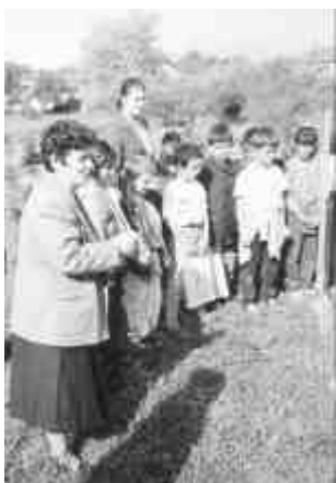
Un momento di gioco "all'aperto" con gli insegnanti

"microintervento": acquistare un telefono-fax e donarlo a questa scuola. Nei mesi successivi fummo sommersi, oltre che dai documenti comprovanti l'acquisto e l'uso di telefono e fax, anche dai ringraziamenti da parte del direttore e degli alunni.