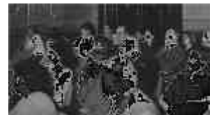
L'assemblea annuale dei soci. Anche quest'anno la presenza è stata discreta. Speriamo di fare meglio nei prossimi anni.