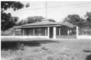
Mansoa, radio "Sol Mansi"

A volte la competizione tra i "possessori" di un apparecchio radio si basa sul numero delle pile elettriche delle quali ha bisogno per funzionare: più ne ha e più è un potente e ambito status symbol.