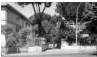
L'ex scuola materna comunale "Giulio Salvatori" dove è la nostra sede operativa.

La corrispondenza tra affidatari e affidati che arriva a noi, di norma, viene inviata ai soci insieme alla documentazione semestrale, a giugno e a dicembre.