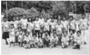
Un gruppo di affidati con le magliette di "A, B, C"

Il proprietario del supermercato si è assunto "volontariamente" il compito di confezionare e di consegnare ogni mese i pacchi alimentari a tutti i bambini del progetto.