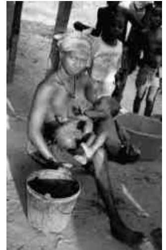
Donna mentre allatta i suoi due bambini