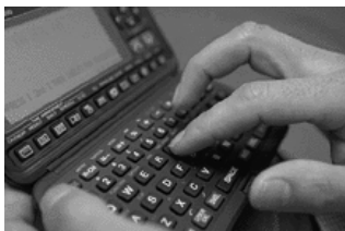
Per far tornare i conti, in una famiglia serba, ci vorrebbe una calcolatrice truccata

Usciamo per la strada e facciamo la spesa. Siamo a Kragujevac, ma sarebbe la stessa cosa se fossimo a Belgrado o a Nis. Infatti, oggi, in Serbia un kg di pane costa 35 dinari, di zucchero 45, di sale 25, di farina 35. Un litro di olio di mais 65, di latte 25. Un hg di caffè 25, di tè 40. Un kg di carne di pollo 120, di maiale 250, di vitello 270, di formaggio bovi-