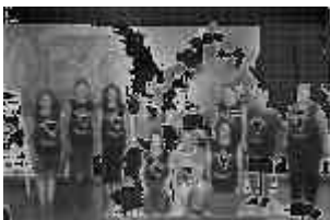
L'équipe al completo, compreso Babbo Natale

Il proprietario del supermercato si è assunto "volontariamente" il compito di confezionare e di consegnare ogni mese i pacchi alimentari a tutti i bambini del progetto.