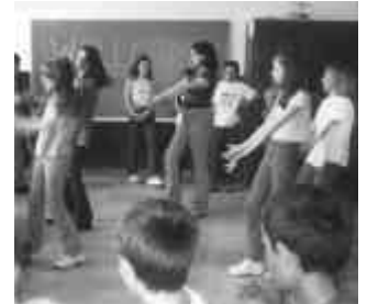
"Welcome" è scritto sulla lavagna della nella piccola scuola "Rodoljub Colakovic", in Donja Vrezina, un sobborgo di Nis.

Appena scendiamo dalla macchina, ci viene incontro una fila d'insegnanti, genitori e bambini, i quali ci offrono una pagnotta: dobbiamo staccarne un boccone, intingerlo nel sale, nel peperoncino e mangiarlo, fra le acclamazioni. E' questa l'usanza locale per dare il benvenuto a ospiti di riguardo. Fatte le consegne delle borse di studio, ecco che i banchi vengono accostati tra loro e si trasformano, come d'incanto, in una lunga tavolata con tovaglie di carta e stoviglie di plastica. Arrivano le mamme portando torte, pasticcini e altre cose, appena sfornate dalle cucine casalinghe secondo ricette economiche ma squisite, poi balli e canti. E' l'occasione per dimenticare il difficile presente!