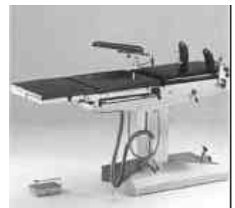
Il tavolo operatorio “Malvestio”, dismesso dall'ospedale di Sinalunga (Siena) che siamo andati a prendere e che spediremo a Bissau.

possibile così organizzare il viaggio e trasportare a Roma questi preziosi oggetti da sala operatoria (meno la sedia a rotelle, naturalmente) che spediremo presto a Bissau. In tutta la Guinea Bissau, attualmente, esiste una sola sala operatoria nell'ospedale statale “Simao Mendez” (Vedi anche a pagina 14).